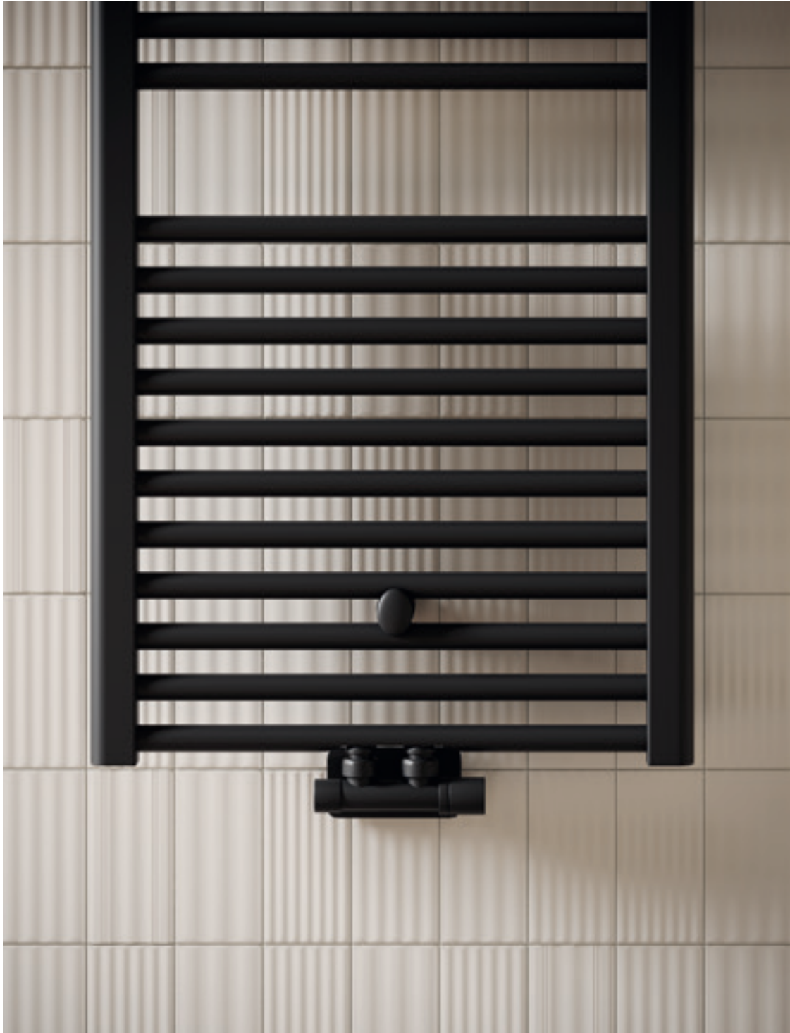
ARES altezza 1462 mm, larghezza 530 mm. Finitura Nero Opaco (cod. K1).